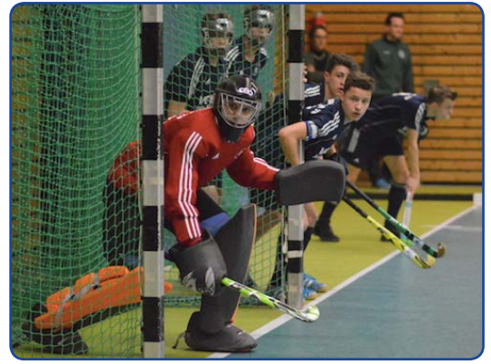
Die männliche Jugend A ist die Basis für die 1. Herren.

STOP --- Und auch den Pokalmannschaften werden weiterhin die Daumen gedrückt, da deren Saison noch läuft. --- STOP --- Seit Herbst 2016 durchgängiges Jugendhockeykonzept in der Umsetzung über alle Jahrgänge von Minis/Wusel bis zum Übergang in den Erwachsenenbereich. Viel Erfolg bei der Umsetzung. --- STOP --- Ebenfalls in der Umsetzung und mit gutem Zuspruch sowie merklichen Erfolgen: Regelmäßiges Fördertraining sowie individuellen Unterstützung des Einzelnen und gezieltes Torwarttraining für den Ausbau dieser speziellen Position (prinzipiell ab B-Bereich bis zum Übergang in den Erwachsenenbereich). --- STOP --- Wusel werden Turniersieger in Celle --- STOP ---