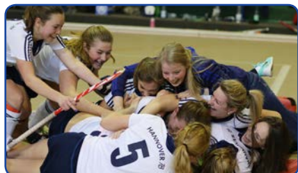
1. Damen Halle: Die Freude über den Erstligaufstieg hielt nur eine Saison.